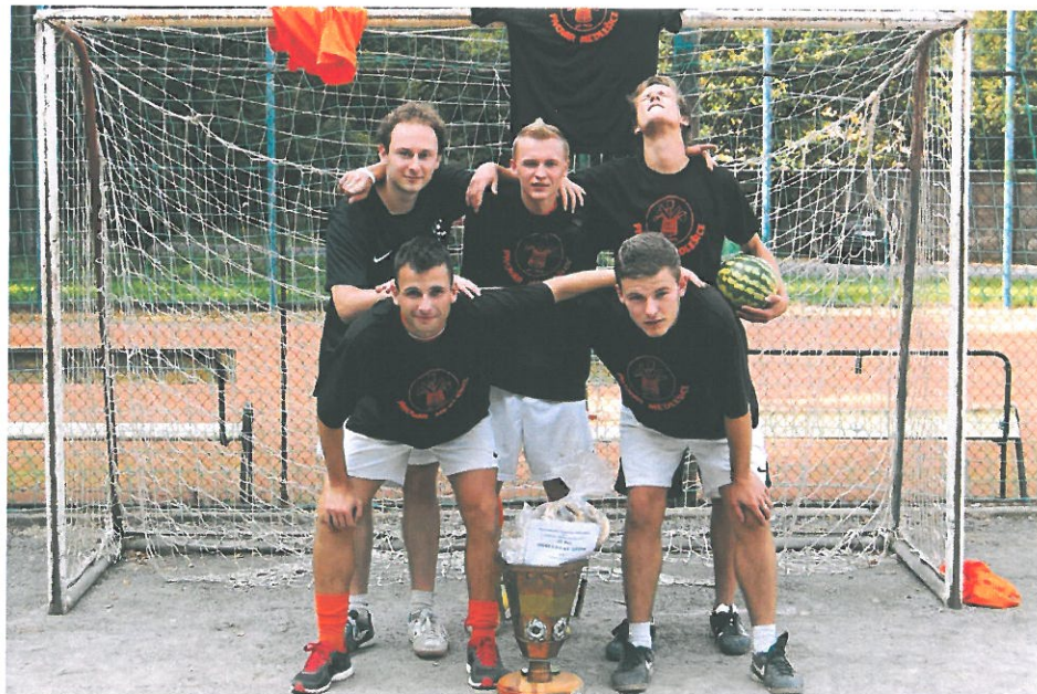
Vítězové: Pivovar Medlešice

Všem účastníkům gratulujeme a na dálku třeseme pravicí!