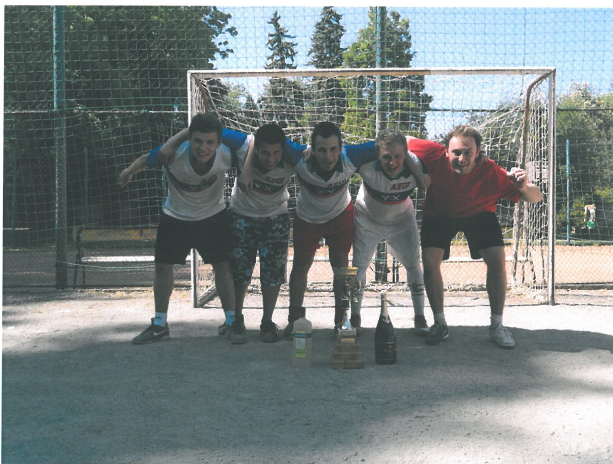
Vítězné mužstvo Šup sem, šup tam Dymáček

Vítězům gratulujeme a všem děkujeme za účast.